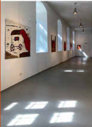
Die Galerie ist während der Ausstellungszeiten täglich von 11–17 Uhr geöffnet.

Die Städtische Galerie Wollhalle stellt ein wahres Kleinod im Ensemble der vielfältigen kulturellen Einrichtungen der Barlachstadt Güstrow dar. Erbaut als herzoglicher Pferdestall im 16. Jahrhundert, genutzt als Lagerplatz und Handelsort für Wolle im 19. Jahrhundert, ist die Wollhalle nach erfolgter Sanierung heute eine moderne Galerie im historischen Gewand. Neben traditionellen Ausstellungen wie der "Laienkunstausstellung" werden hier vorrangig Arbeiten zeitgenössischer, regionaler Künstler gezeigt.