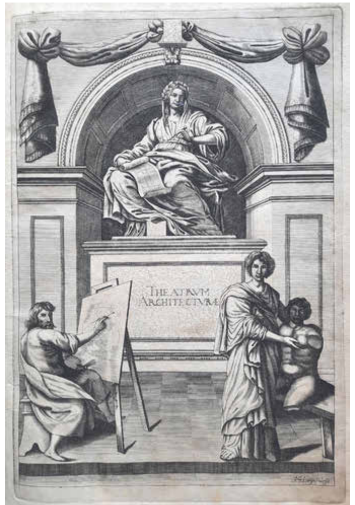
Titelblatt des „Theatrum Architecturae civilis“ von Charle Philippe Dieussart.

Mit einem gemütlichen Beisammensein im Hof des Hauses der Kirche soll der sommerlichen Kunst-Abend ausklingen.