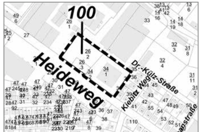
Übersichtsplan: Geltungsbereich des Bebauungsplans Nr. 100 - Einzelhandel Heideweg

Kartengrundlage: ALKIS-Daten MV, Stand: 31.03.2023